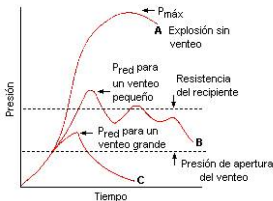
Fig. 1: Gráfico de la presión en función del tiempo de una explosión con y sin venteo

Para la aplicación del venteo de alivio es primordial conocer el desarrollo de la presión en función del tiempo, al producirse una combustión explosiva.